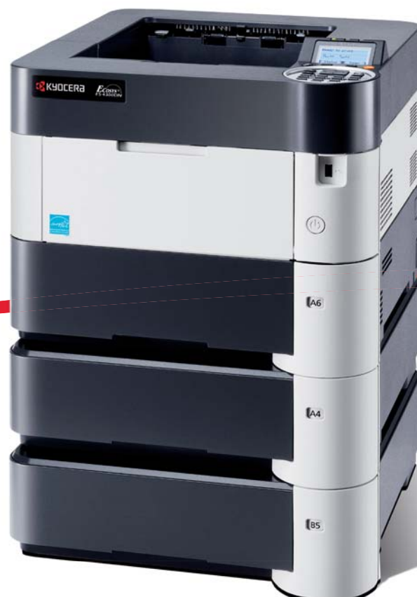
Abbildung mit Optionen.